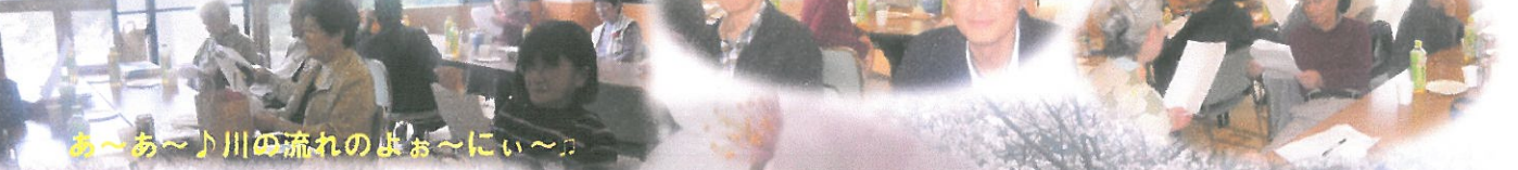
あ〜あ〜川の流れのよお〜にい〜