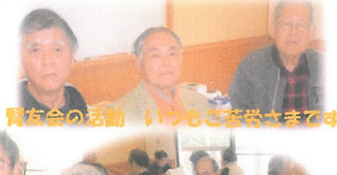
腎友会の活動 いつもご苦労さまです