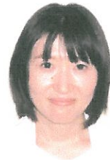
透析センター 看護科長