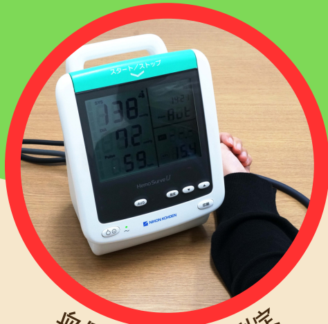
血圧・動脈硬化測定