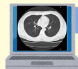
済生会今治第二病院

済生会今治第二病院では遠隔画像診断システムを導入しており、愛媛画像診断支援センターの画像診断医によってCTデータの精密な診断が行われています。