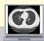
愛媛画像診断支援センター