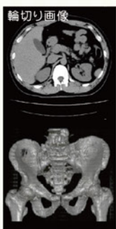
輪切り画像を重ね合わせて立体的に3D表示した画像骨盤部分を正面からみている画像