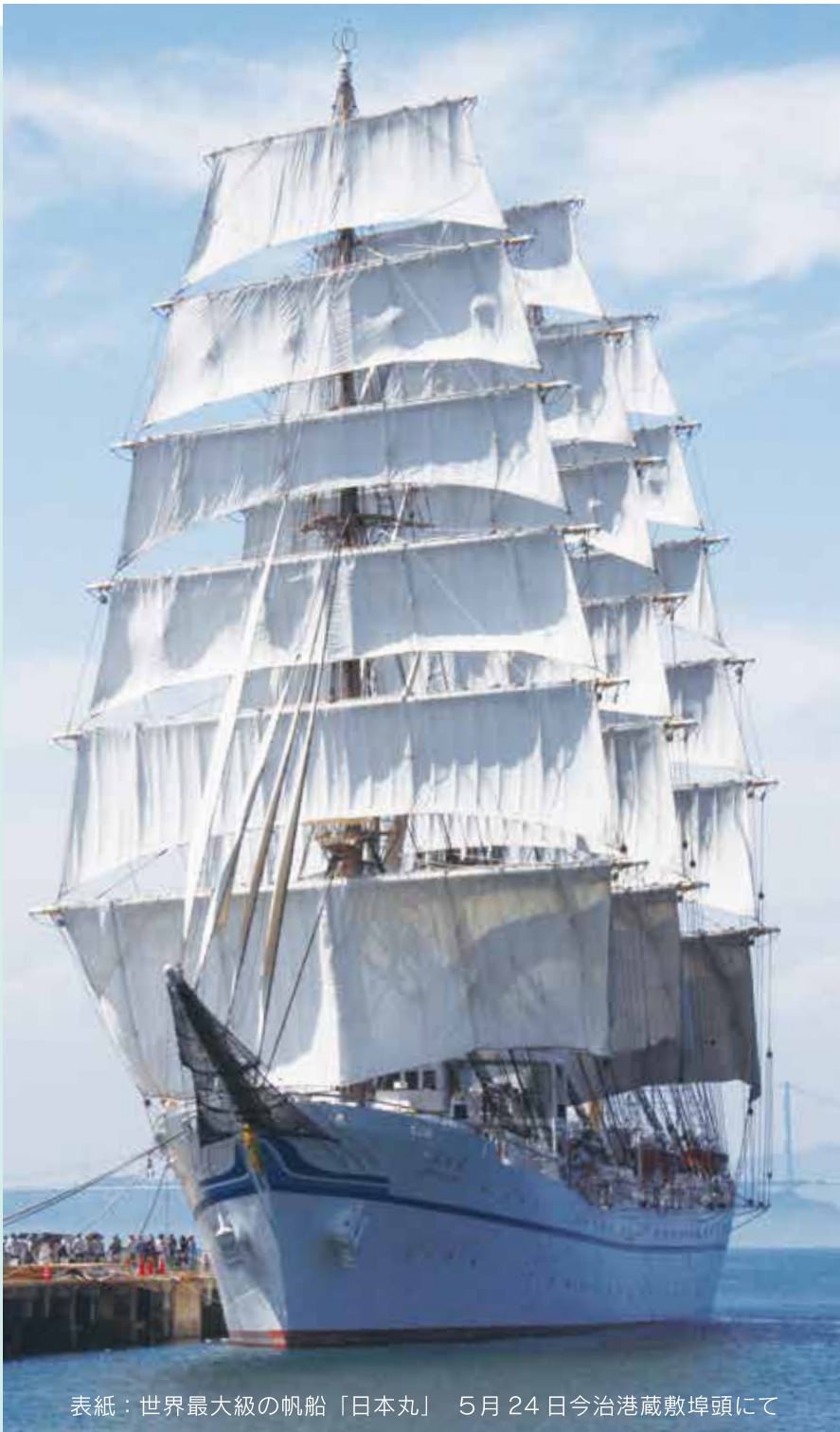
表紙：世界最大級の帆船「日本丸」 5月24日今治港蔵敷埠頭にて