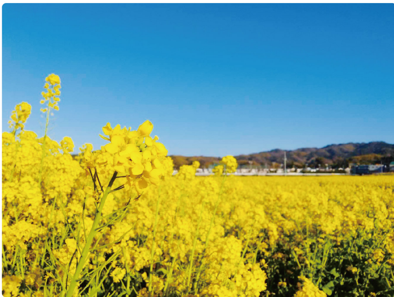
当院職員撮影「今治市大西町 菜の花畑」