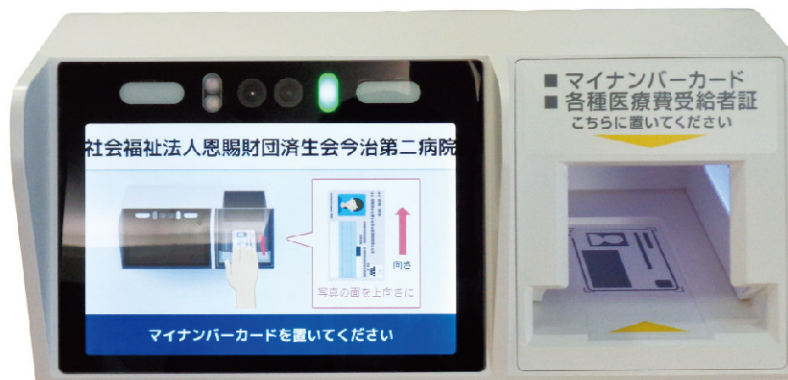
顔認証付きカードリーダー

公費負担医療制度(生活保護、難病医療等)をご利用中の方については、各種証明書のご提示は引き続き必要となります。今まで通り、各種証書を窓口にご提示ください。