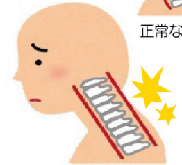
ストレートネック