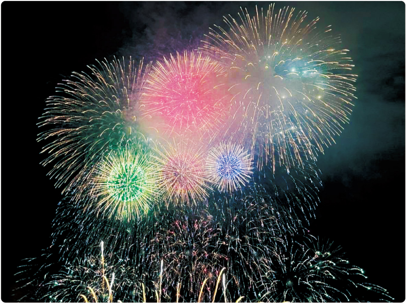
「今治市 おんまく花火大会」