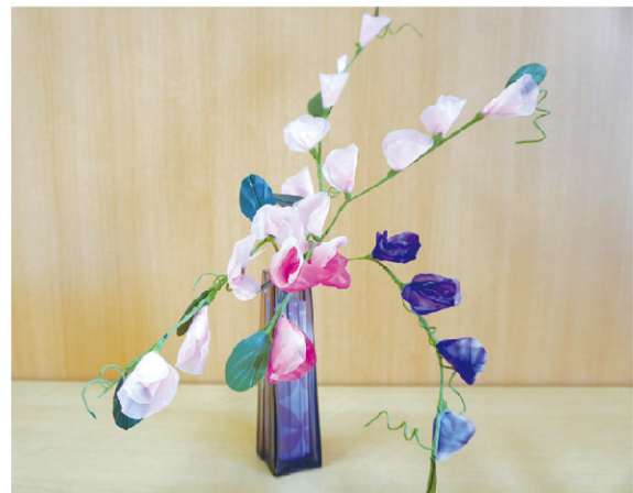
たけうち まさえ 竹内 正江様

リボンをコテでまいて花びらにし、ツルも手作りされています。とてもかわいい、スイートピーです。