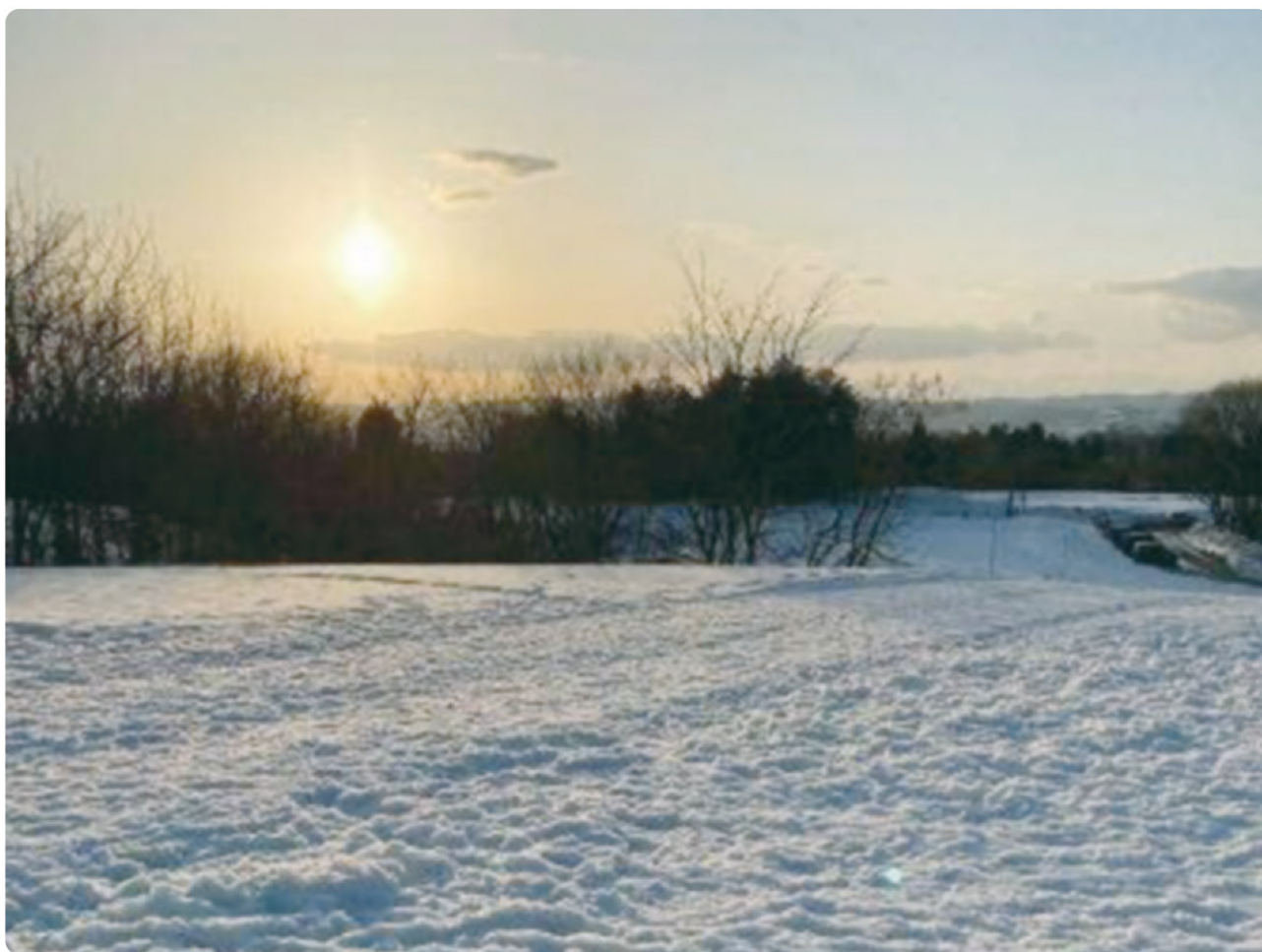
「新潟県 ふれあい農業公園」