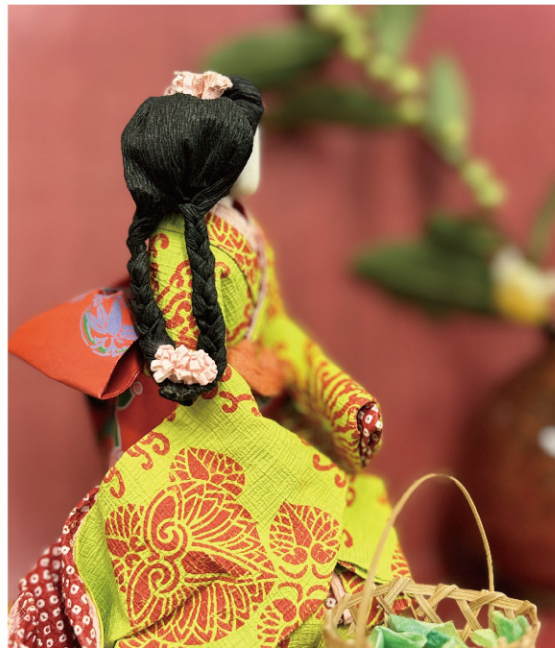
むら かみ やす こ 様 村上 泰子様