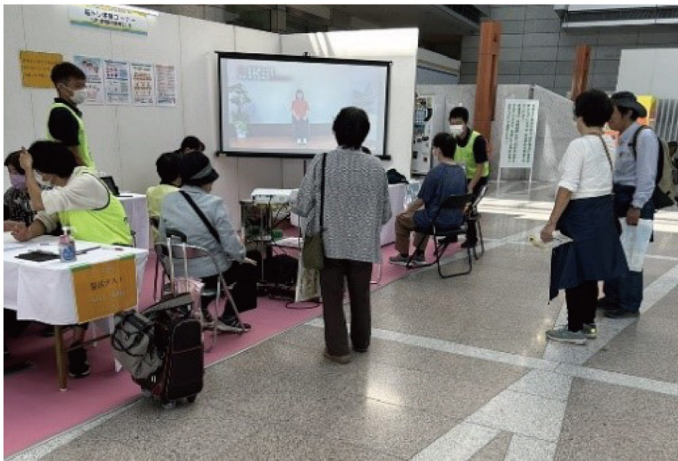
ねんりんピックの様子

認知症予防の近道は自分に合った予防策をひとつでも多く見つけ、無理なく楽しく取り組むことです。なるべく早く始めるに越したことはありませんが、何歳であっても「やってみよう」と思った時が認知症予防の始め時です。当院でも、PCソフトを用いた認知機能トレーニングや、コグニサイズを応用した認知症予防体操など、認知症予防について取り組んでおりますので、お気軽にご相談ください。