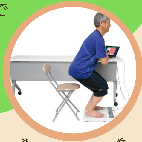
立ち上がり機能検査