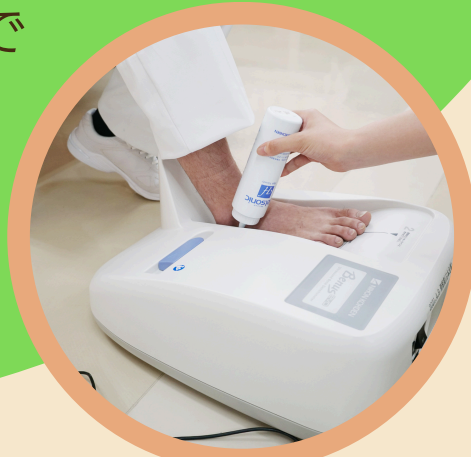
骨密度測定 ※素足で測定します