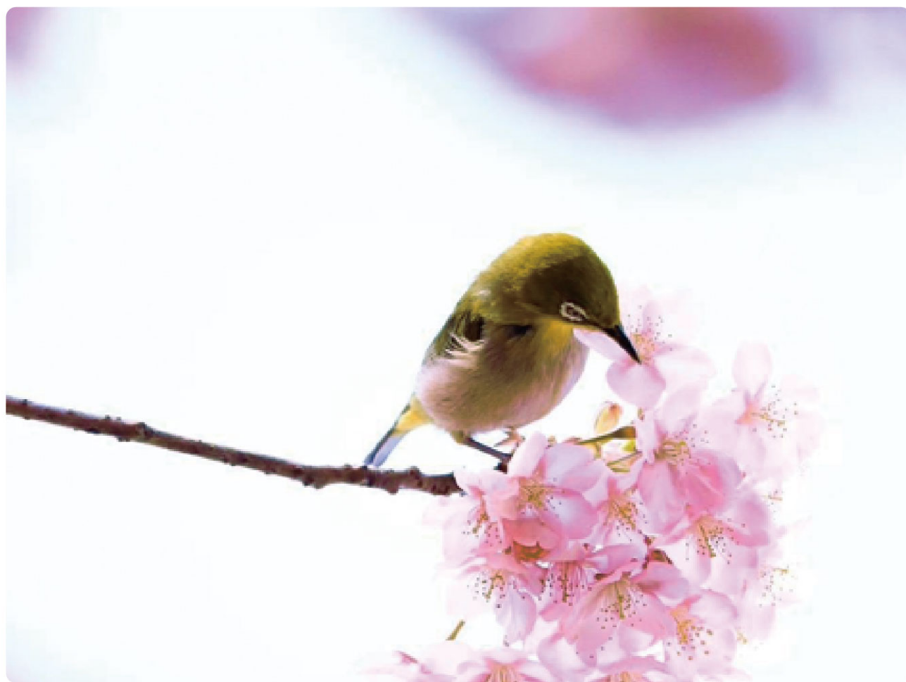
「今治市 藤山健康文化公園」