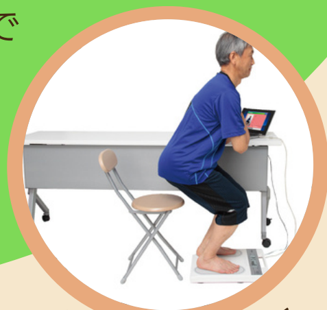
立ち上がり機能検査